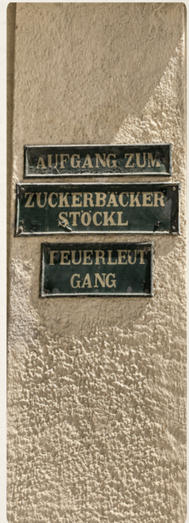
Historische Dienstweg-Beschilderung, Schönbrunn, Wien.

Eine Stadt spricht auch durch das, was sie auslässt, verschiebt oder nicht erklärt.