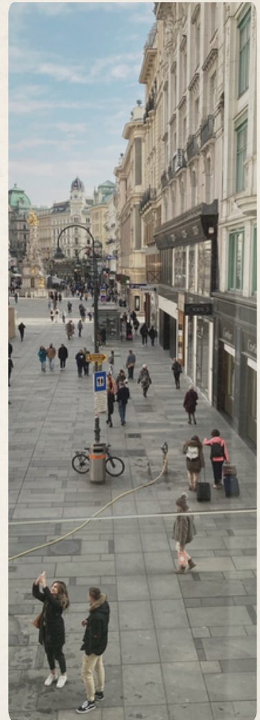
Blick auf den Graben, Wiener Innenstadt.

Aber großzügig, wenn man sich ihm mit Sorgfalt nähert.