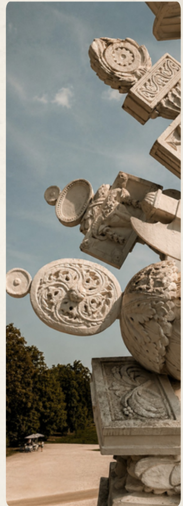
Architekturdetail der Gloriette, Schönbrunn, Wien.

Sie ist oft eine Sprache von Macht, Zugehörigkeit, Hingabe, Streben und Erinnerung.