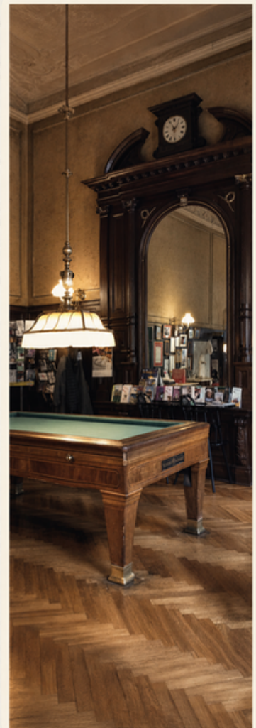
Innenraum des Café Sperl, Wien.

Welche Jahrhunderte sind hier gleichzeitig anwesend?