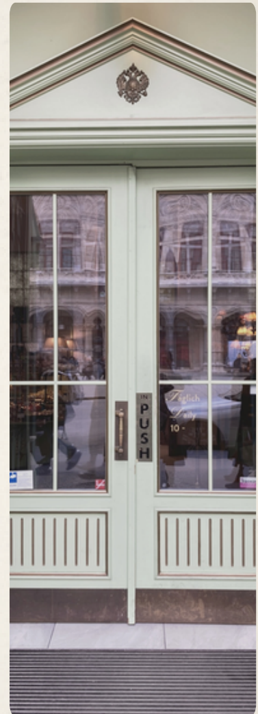
Tür in Wien. K.u.K. Café-Konditorei L. Heiner.

Fragen Sie sich, in welche Welt dieser Eingang Sie führen soll – und wer vielleicht einen anderen Weg nehmen musste.