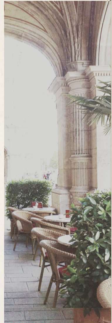
Opern Café, Wiener Innenstadt.

Welche Arbeit, welche Sehnsucht, welche Ordnung und welche Geschichte stehen hinter dieser Schönheit?